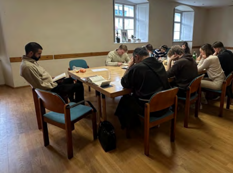
© Text: Jeffrey Fürst

Ob Corona-Krise, Nahostkonflikt, Klimaerwärmung und vieles mehr – unser Zeitgeist ist geprägt von Verunsicherung und Unruhe. Diese Vielzahl von Bäumen durchforsteten junge Erwachsene unter der geistlichen Führung von Br. Marek Krol beim Einkehrtag zum Thema „christliche Hoffnung“ am 29. November, auf dass sie den Blick auf den Wald, das große Ganze, behalten oder wiedergewinnen.