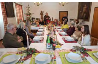
LEIBNITZ: VERGESST DIE DANKBAR- KEIT NICHT S 7