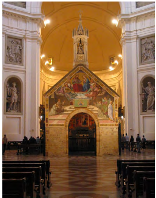
Die Kapelle Santa Maria degli Angeli zu Portiunkula

Abschließend seien noch einige hilfreiche Gedanken von Bischof Nykiel zum Ablass und zu der Bedingung der „Abkehr von jeder Sünde“ angeführt. Der Ablass, so sagt er, sei eine Art geistliche Abkürzung. Das meint allerdings nicht ein trügerisches Vorbeischlüpfen an Recht und Billigkeit. Der Ablass ist in erster Linie eine Begegnung mit Gott. Bei der Abkehr von jeder Sünde, so sagt er weiter, geht es nicht um die Abwesenheit von Schwäche, sondern um die Entscheidung des Willens. Wer aufrichtig sagt: „Herr, ich will keine Sünde, ich verabscheue sie, auch wenn ich schwach bin“, der erfüllt die Bedingung, um einen Ablass zu gewinnen. ■