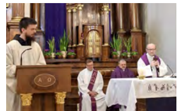
GLICHOW DAS EVANGELIUM IM TEILEN S10