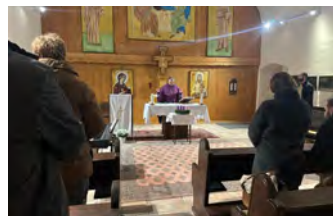
WIENER NEUSTADT: CHRISTLICHE HOFFNUNG S 8